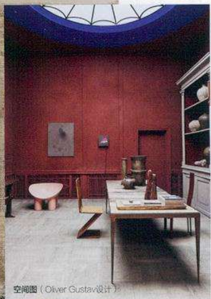
空间图 (Oliver Gustav设计)