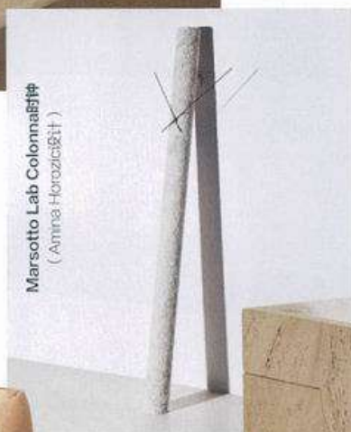
Marsotto Lab Colonna设计 (Anna Horozic设计)