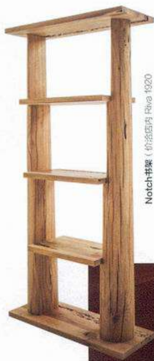
Notch书架 (价治店内 Riva 1920 from: Area Living艾玛亚家居)