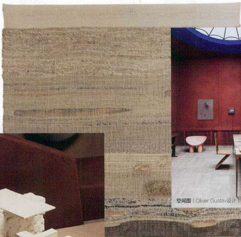
Tapestry挂毯 (价治店内 Nanimarquina from Design Republic设计共和)