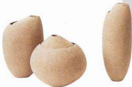
Mantiqueira花瓶 (Domingos Tótorai设计 Tacchini)

受到禅宗与侘寂美学的影响，赤贫风将装饰中的纯粹主义发扬光大，放大古朴的质感，把细节做到精致，呈现返璞归真的自然状态，寻找粗犷和细腻之间的平衡。