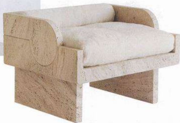
Gallipoli限量版扶手椅 (Stéphane Parnentier设计 Studiowentysseven)