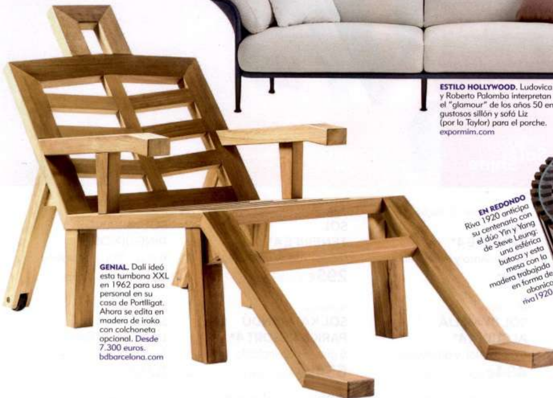
GENIAL. Dalí ideó esta tumbona XXL en 1962 para uso personal en su casa de Portlligat. Ahora se edita en madera de iroko con colchoneta opcional. Desde 7.300 euros. bdbarcelona.com