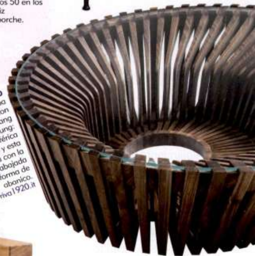
EN REDONDO Riva 1920 anticipa su centenario con el dúo Yin y Yang de Steve Leung: una estética butaca y esta mesa con la madera trabajada en forma de abanico riva 1920.it