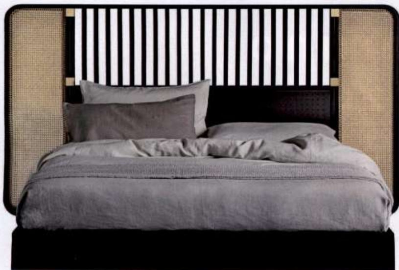
SUEÑOS DE DISEÑO El cabecero extiende su geometría por la pared de la mano del estudio Störagemilano. Una revitalización de la rejilla para el dormitorio. Desde 4.170 euros. gebruederthonetvienna.com