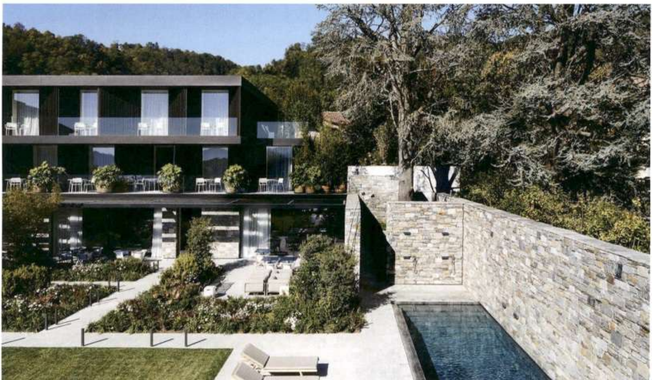
Der Anbau ist maßstäblich eingefügt. Seine Rückfassade weist zum Garten. Glasbrüstungen erlauben eine uneingeschränkte Sicht von den Zimmern aus. (GG)