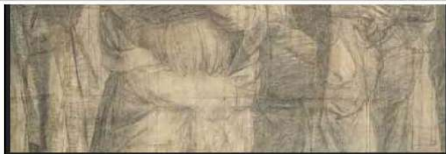
Sacramento), la Giurisprudenza (Le Virtù) e la Poesia (Il Parnaso).

Il Cartone dell'Ambrosiana si è conservato integralmente poiché non venne effettivamente utilizzato per trasportare il disegno di Raffaello sulla parete, ma per mostrare al Papa l'effetto complessivo dell'opera una volta ultimata.