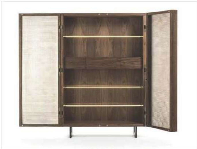
Vitre 2, Riva 1920