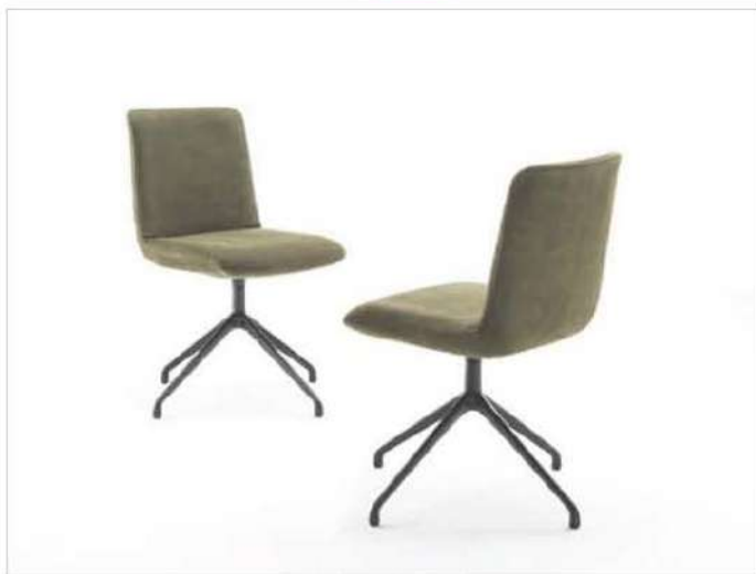
Materia Soft, Riva 1920