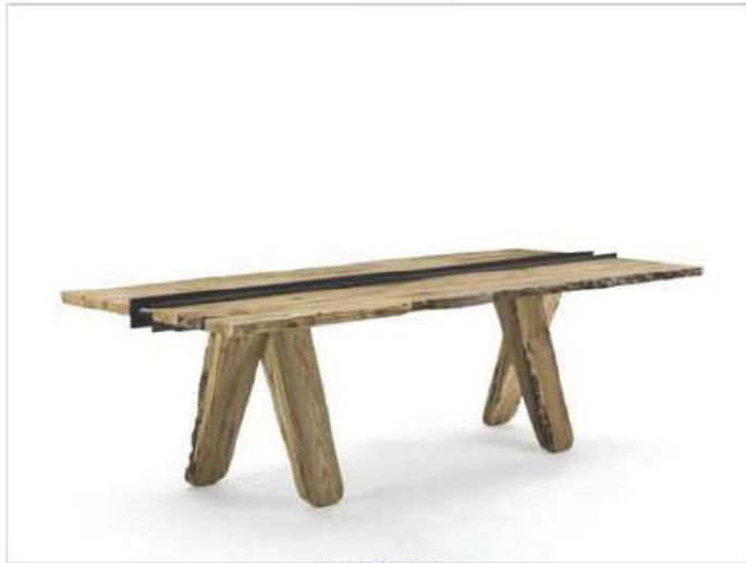
Canal, Riva 1920