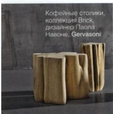
Кфейные столики, коллекция Brick, дизайнер Паола Навоне, Gervasoni

Ключевым желанием заказчиков было создание максимально открытого, перетекающего пространства, решенного в стиле минимализм. В кухне-столовой между функциональными зонами отсутствуют какие-либо перегородки. В интерьере активно использованы белый цвет и контрастные сочетания. Благодаря предельной функциональности был достигнут комфорт без лишних деталей».