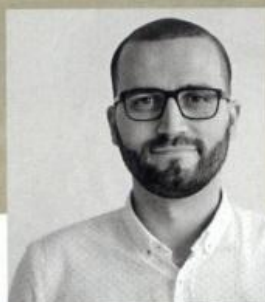
Авторы проекта Илья Темнов, Константин Турбин