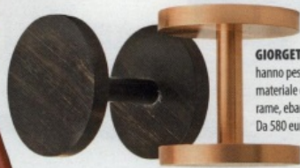
GIORGETTI. I manubri Ares hanno pesi diversi a seconda del materiale con cui sono realizzati: rame, ebano, onice, marmo... Da 580 euro. giorgetti.com