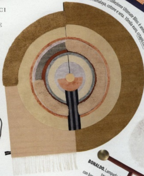
CCTAPIS. Tappeto della collezione Ultimate Bliss è annodato a mano con lana dell'Himalaya, cotone e seta. 10 mila euro. cctapis.com