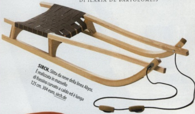
SIRCH. Slitta da neve della linea Abyss. È realizzata in massello di frassino curvato a caldo ed è lunga 125 cm. 304 euro. sirch.de