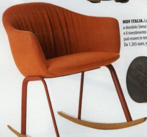
MDF ITALIA. La poltroncina a dondolo Siena ha la scocca rigida e il rivestimento dell'imbottitura può essere in tessuto o pelle. Da 1.265 euro. mdfitalia.it