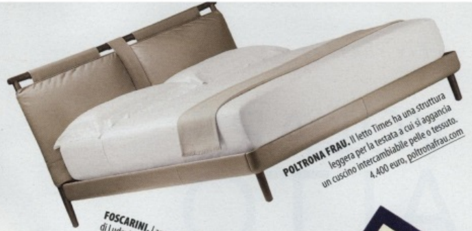
POLTRONA FRAU. Il letto Times ha una struttura leggera per la testata a cui si aggancia un cuscino intercambiabile pelle o tessuto. 4.400 euro. poltronafrau.com