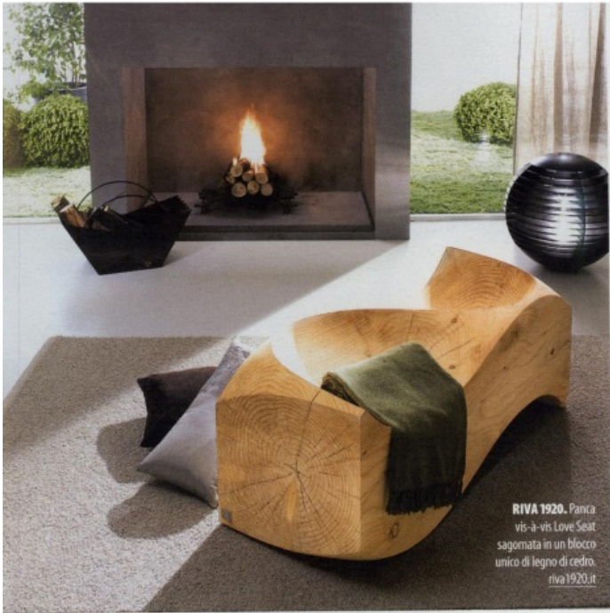
RIVA 1920. Panca vis-à-vis Love Seat sagomata in un blocco unico di legno di cedro. riva1920.it