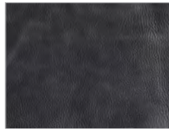
Leder utah: 108