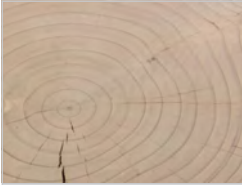
Zeder contract Ausführung