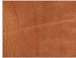
Leder utah: 103