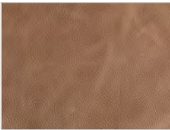
Leder utah: 106