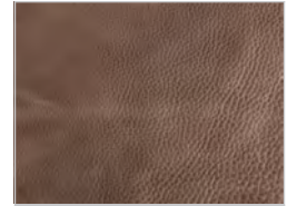
Leder utah: 105