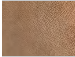
Leder utah: 102