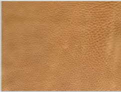
Leder utah: 101