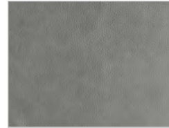
Leder utah: 104